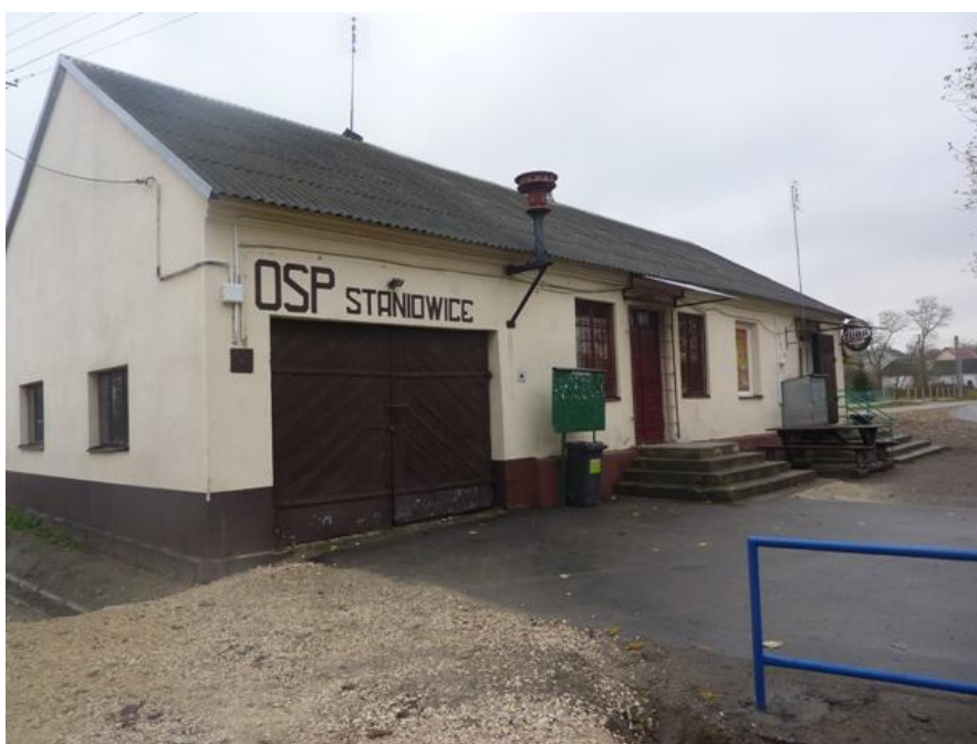
Zdjęcie nr 7 - Budynek remizy OSP Staniowice/ świetlicy wiejskiej.

Od 1932r. funkcjonuje Ochotnicza Straż Pożarna. Obecnie straż wyposażona jest w niezbędny sprzęt gaśniczy: samochód, pompę, dodatkowy sprzęt gaśniczo-ratunkowy.