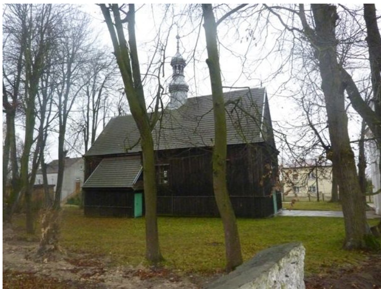
Zdjęcie nr 5 - Zabytkowy Kościół oraz dzwonnica bramna w miejscowości Chomentów do której parafii należą mieszkańcy Staniowic.

Analizując poszczególne elementy przesądzające o atrakcyjności położenia danej miejscowości, należy wziąć pod uwagę m.in. infrastrukturę turystyczną lub około turystyczną znajdującą się w samej wsi jak i w jej pobliżu. Niewątpliwie atutem jest znajdujący się zabytkowy Kościół oraz dzwonnica bramna w miejscowości Chomentów, do której parafii należą również mieszkańcy Staniowic.