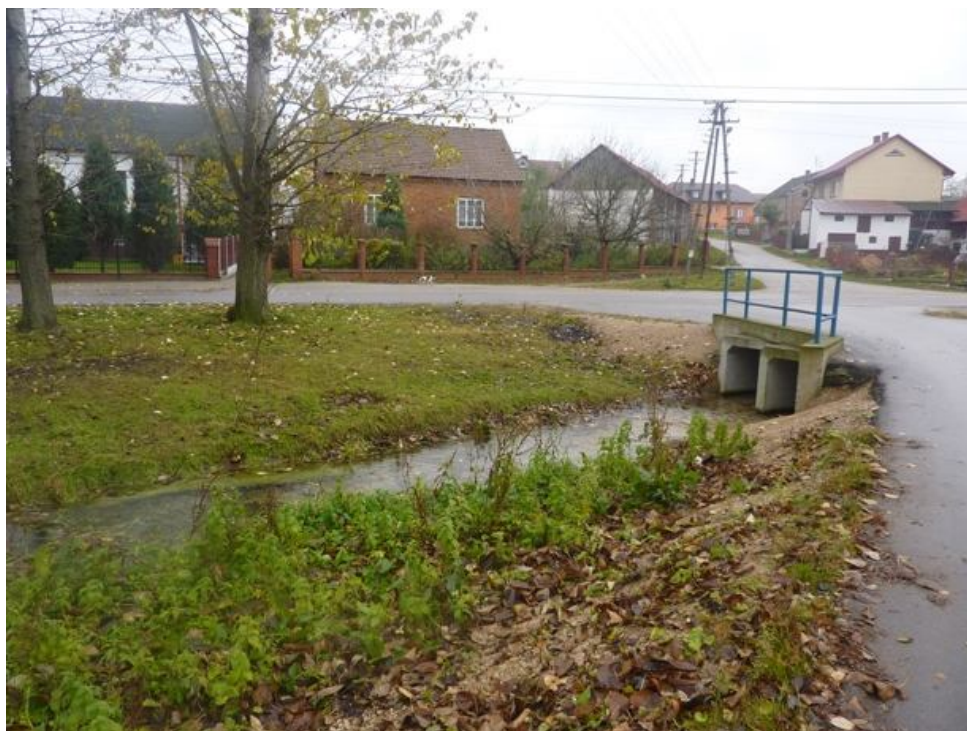
Zdjęcie nr 4 Strumyk „Struga”.

Przez miejscowość przepływa zaniedbany strumyk „Struga”. Nieuregulowane koryto na niektórych odcinkach jest powodem małych podtopień, w okresie obfitych opadów deszczowych.