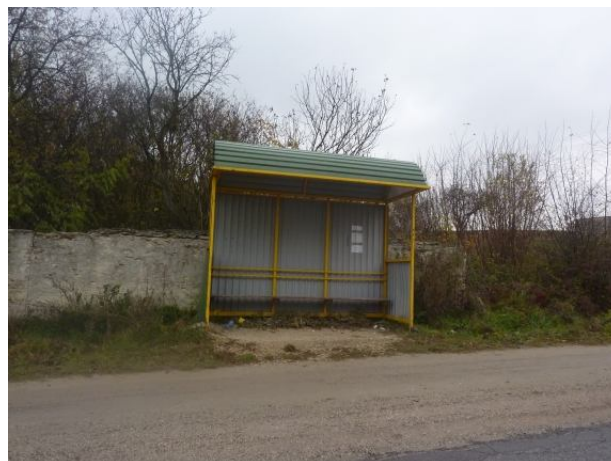
Zdjęcie nr 11 - Przystanki autobusowe zlokalizowane w miejscowości Staniowice.

Istniejąca sieć wodociągowa o średnicy \square 110\text{mm} zaopatrywana w wodę z ujęcia zlokalizowanego na terenie sołectwa Sobków. Ujęcie wody składa się z dwóch studni: zasadniczej, o wydajności 105\text{ m}^3/\text{h} przy depresji 16,7\text{m} i studni awaryjnej, o wydajności 92\text{m}^3/\text{h} przy depresji 15\text{m} .