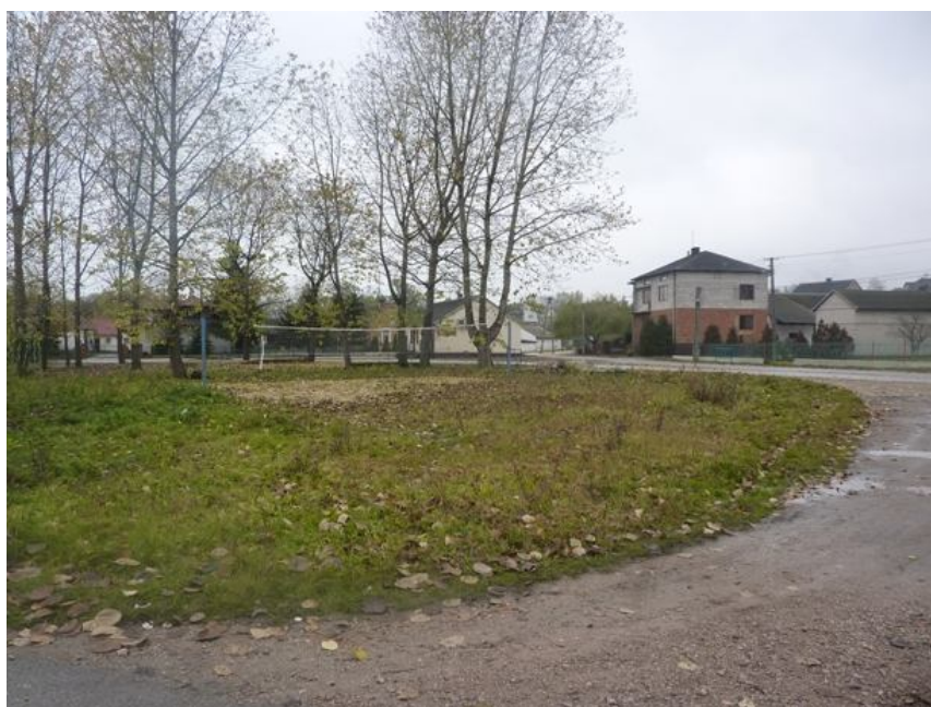
Zdjęcie nr 8 - Centrum wsi Staniowice.

W pobliżu świetlicy wiejskiej znajduje się boisko do piłki siatkowej. W ciepłe dni dzieci chętnie korzystają z gier na świeżym powietrzu, niestety brak jest infrastruktury towarzyszącej tej inwestycji. Brak jest ławeczek, koszy na śmieci itp. W związku z tym, iż boisko jest również zlokalizowane w obrębie centrum miejscowości ważne jest jego odpowiednie zagospodarowanie sprzyjające poprawie estetyki miejscowości.