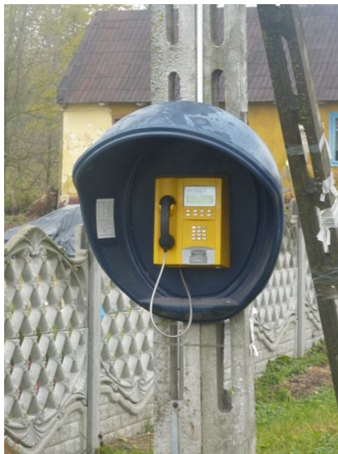
Zdjęcie nr 13 - Ogólnodostępny aparat telefoniczny w miejscowości Staniowice.

W zakresie telekomunikacji, miejscowość obsługuje automatyczna centrala telefoniczna TP S.A., łącząca telefony z siecią krajową. Powszechne jest również korzystanie z usług telefonii komórkowej. Mieszkańcy mają również dostęp do Internetu zarówno drogą radiową jak i poprzez łącze TP. W Staniowicach znajduje się również budka telefoniczna, publicznego dostępu.