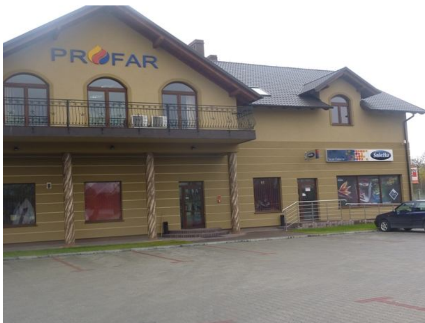
Zdjęcia nr 14 - Budynek zakładu PROFAR.

Handlowy PROFAR Sp. z o.o. , działający w obszarze branży budowlanej. Sklep posiada bardzo urozmaicony asortyment. Zakład zatrudnia około 30 osób.