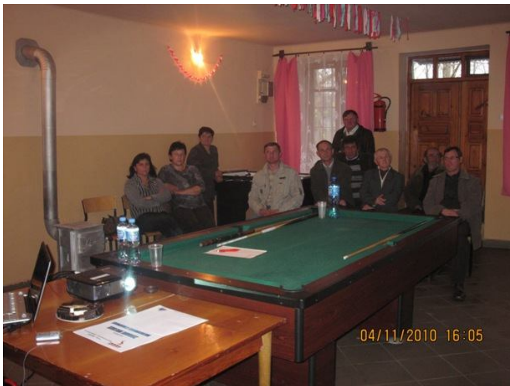
Zdjęcia nr 1 i 2 - zebranie robocze w sprawie Odnowy wsi w miejscowości Staniowice w dniu 4 listopada 2010r.