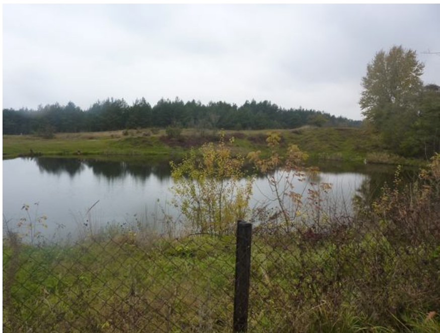
Zdjęcie nr 3 - Staw zwany „Glinianką”.

Przez miejscowość przepływa zaniedbany strumyk „Struga”. Nieuregulowane koryto na niektórych odcinkach jest powodem małych podtopień, w okresie obfitych opadów deszczowych.