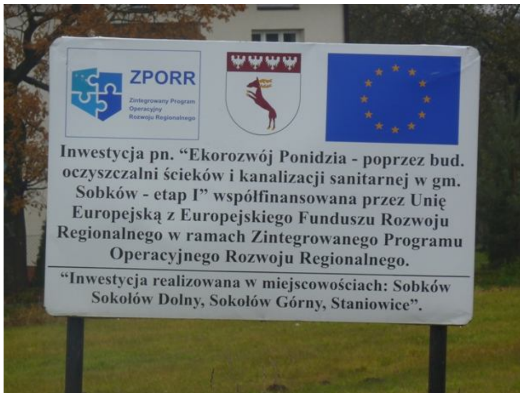
Zdjęcie nr 12 - Tablica informacyjna o dofinansowaniu projektu budowy oczyszczalni ścieków i kanalizacji m.in. w miejscowości Staniowice.