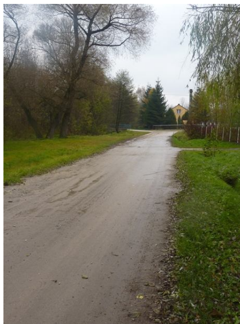
Zdjęcie nr 10 - Drogi we wsi Staniowice.

Drogi we wsi nie są w zadowalającym stanie technicznym. Oprócz słabej nawierzchni asfaltowej w niektórych punktach, brak jest również chodników zapewniających bezpieczeństwo przechodniów.