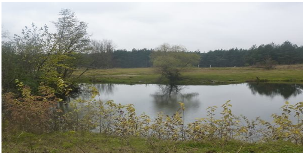
Zdjęcie nr 9 - W tle boisko piłkarskie we wsi Staniowice.

Opiekę zdrowotną świadczy Ośrodek Zdrowia w Sobkowie, w którym dostępna jest opieka ogólnolekarska i stomatologiczna. Zadania z zakresu bezpieczeństwa realizuje posterunek policji w Sobkowie, który podlega Komendzie Powiatowej w Jędrzejowie. Obejmuje on swoim działaniem teren całej Gminy.