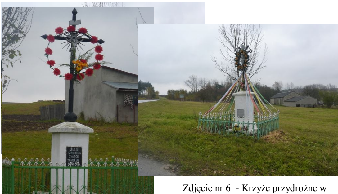
Zdjęcie nr 6 - Krzyże przydrożne w Staniowicach.

Przywiązanie do tradycji i religii katolickiej przejawia się w przydrożnych krzyżach i kapliczkach.